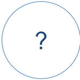
Vacature afdelingsleider 4, 5 en 6 vwo